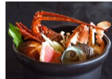
※写真はすべてイメージです。

※水戸駅～伊豆急下田駅まで、通常期往復 21,320円が、お宿とセットでこの価格！