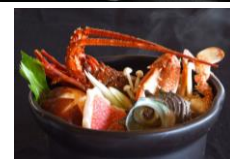
※写真はすべてイメージです。

※水戸駅～伊豆急下田駅まで、通常期往復 21,320円が、お宿とセットでこの価格！ (運賃+常磐線特急列車普通指定席+東海道線特急列車普通車指定席)