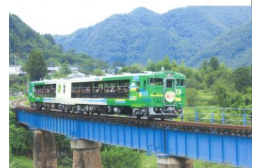
展示写真イメージ