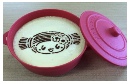
みとちゃんプリン（税込350円）