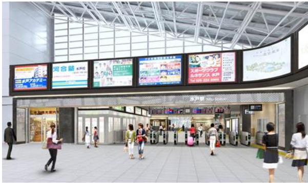
正面改札ゲート (イメージ)

JR東日本水戸支社では、水戸エリアの玄関口としてふさわしい駅の環境整備を行うとともに、合わせて店舗のリニューアルも実施致します。上野東京ラインの開業を来春に控え、地域の皆さまはもちろん、観光やビジネスで訪れたお客さまにも愛される魅力ある駅づくりを目指します。新しくなる水戸駅にどうぞご期待下さい。