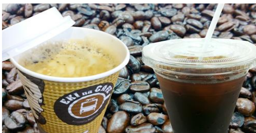
EKI na CAFÉ (税込100円)