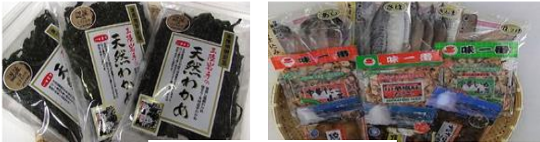
地元産の海産物、珍味など