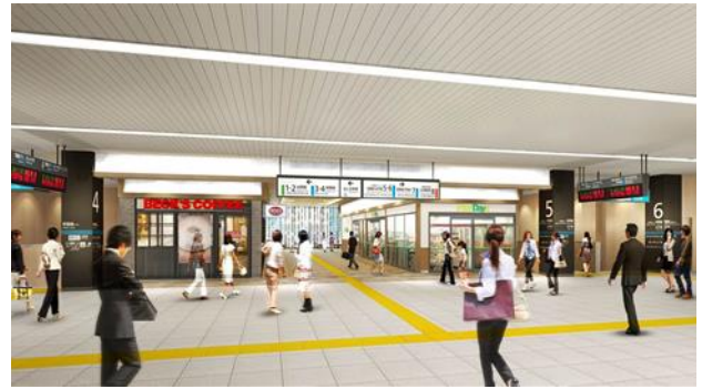
店舗ゾーン (イメージ)