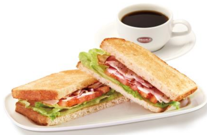
クラブハウスサンド各種（税込390円～） コーヒー各種（税込230円～）