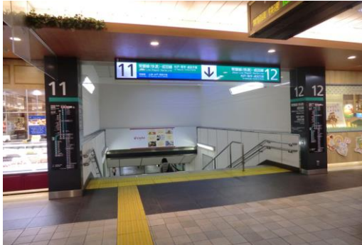
ゲートサイン (イメージ)

各ホームへの移動がスムーズに行えるよう階段付近の案内サインをスタイリッシュでわかりやすい統一された視認性の高いものに変更します。これにより、今以上にお客さまにスムーズでわかりやすい乗り場案内ができます。