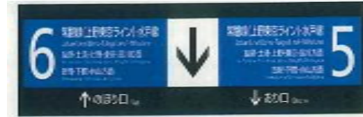
案内サイン (イメージ)