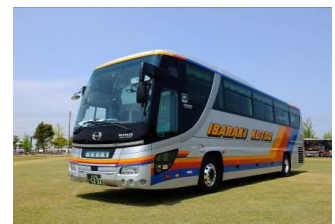
【笠間益子間を結ぶワンコインバスイメージ】