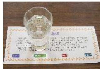
地酒飲みくらべ(イメージ)