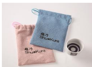
おちょこ・巾着(イメージ)