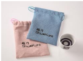
おちょこ・巾着(イメージ)