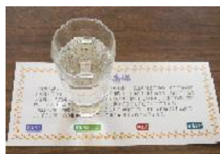
地酒飲みくらべ(イメージ)