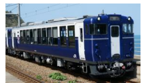
越乃 Shu*Kura (イメージ)