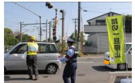
踏切での啓発活動イメージ写真