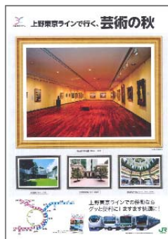
ポスター2種類 (イメージ)