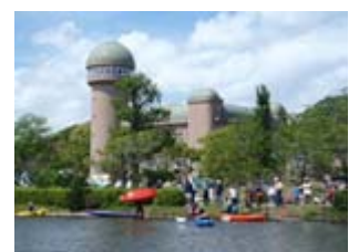
手賀沼親水広場・水の館

行楽シーズンにぴったりの季節。海の生き物を音・光・映像による新感覚による演出を楽しめるエプソン アクアパーク品川やサイクリングなど家族で楽しめる手賀沼親水広場。また、麒麟ビール取手工場ではビールの魅力が存分に味わえるツアー(予約制)など、日帰りでも楽しいスポットを紹介しています。