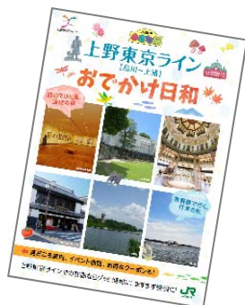
パンフレット (イメージ)