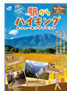
パンフレット (イメージ)