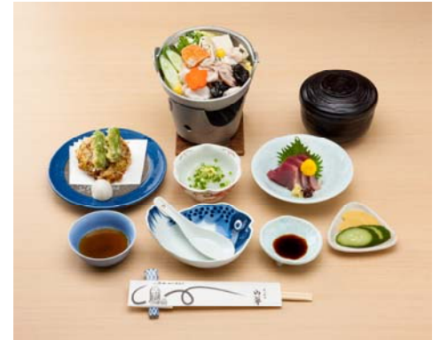
【「水戸山翠」料理の一例】

その他、「五鐵夢境庵」黄門料理コース、水戸駅ビル6階 レストラン食事券(1,000円分)コースがございます。