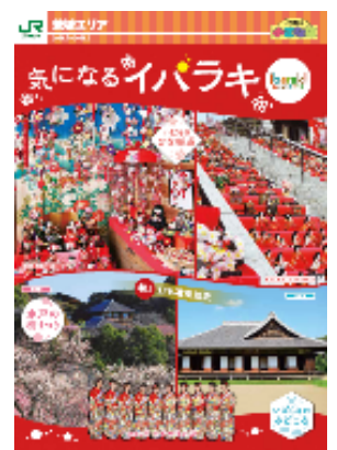
【小さな旅パンフレット】

☆「小さな旅」パンフレットを片手に水戸市内を散策できる市内マップとおすすめ観光スポット、食事・カフェの紹介等。