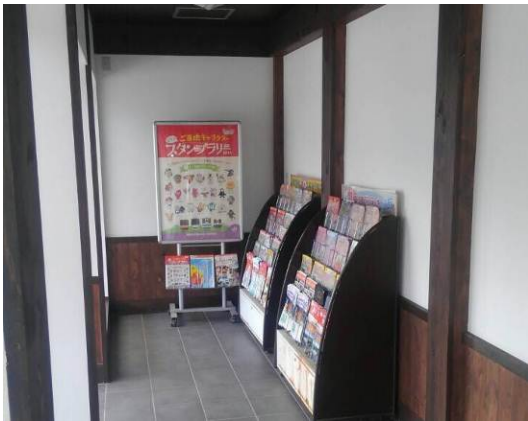
【観光案内所】※イメージ