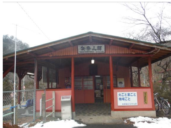
【改良前ファサード】