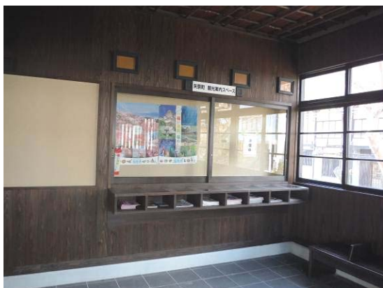
【観光案内スペース】