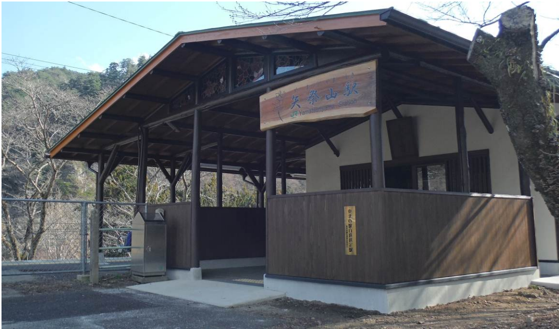
【改良後ファサード】