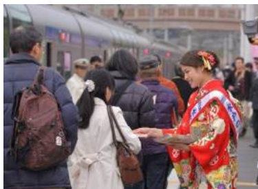
〔水戸の梅大使によるお出迎え〕

臨時駅開設日には、「水戸の梅大使」がホームにてお出迎えを行い、開設日初日（2月20日）には、梅まつりの開幕とリニューアルオープンを記念して、梅の「植樹式」とおもてなしイベントを実施しました。