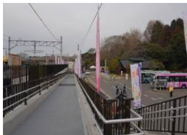
〔スロープを新設した臨時駅〕