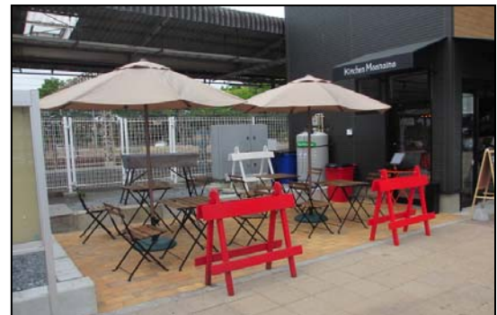
【街路空間に隣接するテラススペース】