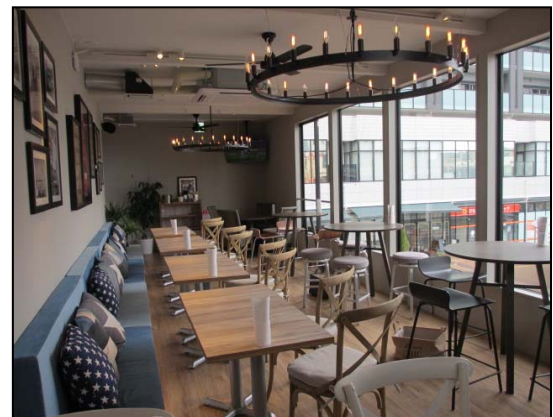
【ワイドな窓で開放感のある店内2階】