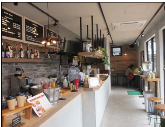
【西海岸通りのカフェをイメージした店内1階】