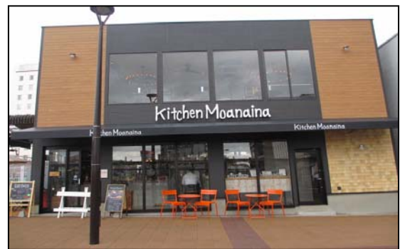
【ナチュラルで落ち着きのある店舗外観】

1階カウンター席 7席 2階テーブル席 33席 計40席 テラススペース 8席 合計48席