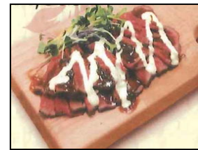
【ローストビーフ盛り合わせ】