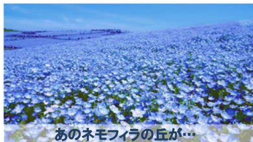
あのネモフィラの丘が…

「ネモフィラ」を楽しめる絶景として認知度が高まったひたち海浜公園「みはらしの丘」の夏の姿として、「緑のコキア」をご紹介しております。ふわふわ、モコモコとしたかわいらしいコキアが一面に広がる絶景をぜひご覧ください。