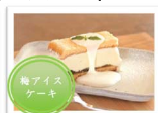
大洗 ume cafe WAON