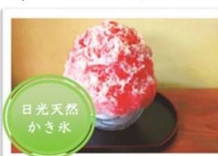
東水戸 都戸美煎本舗 水戸大洗店