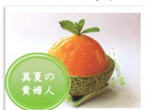
笠間 グリュイエール

茨城県央エリアの以下4店舗について、夏のイチ押しスイーツをご紹介しております。紙面でご紹介している「笠間工芸の丘」や「アクアワールド・大洗」からも足を伸ばしやすいお店です。夏らしい、さわやかな風味をお楽しみください。