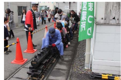
ミニ SL 運転体験乗車イメージ

土浦駅をご利用のお客さまに短冊を作成していただき、七夕を彩る竹に飾り付けを行うイベントを開催いたします。作成いただいた短冊は、土浦市役所イベントブース（ウララ広場）に飾り付けをいたしますので、是非ご参加下さい！！