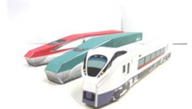
ペーパークラフトイメージ