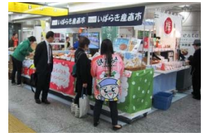
「いばらき産直市」イメージ