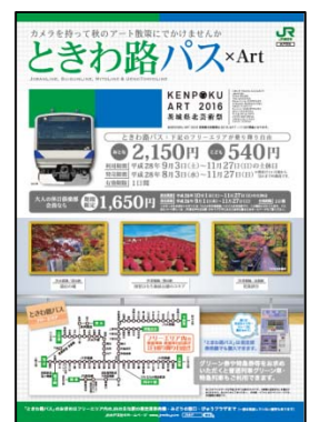
「ときわ路パス」パンフレットイメージ