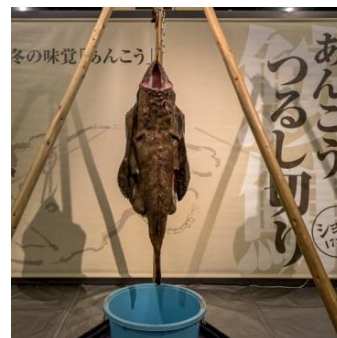
あんこうつるし切り (イメージ)