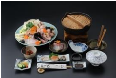
水戸山翠 さんすい あんこう料理（イメージ） ※写真のあんこう鍋については3人前となります

五鐵 ごてつ 夢境庵 むきょうあん どぶ汁仕立て（味噌味）のあんこう鍋を含むあんこう料理