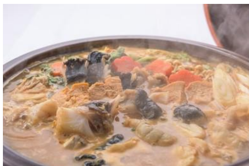
大洗ホテルあんこう鍋 (イメージ)

夕食は、あん肝を練り込んだ味噌で作る秘伝の割り下で煮込んだ、この土地本来の伝統的なあんこう鍋とーフバイキングをお楽しみください。