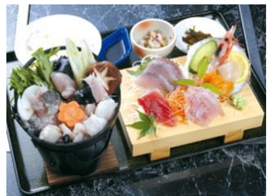
あんこう鍋定食(イメージ)