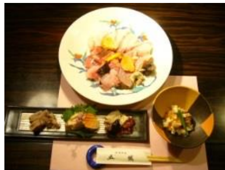
ごてつむきょうあん ごてつむきょうあん 五鐵夢境庵あんこう料理（イメージ）