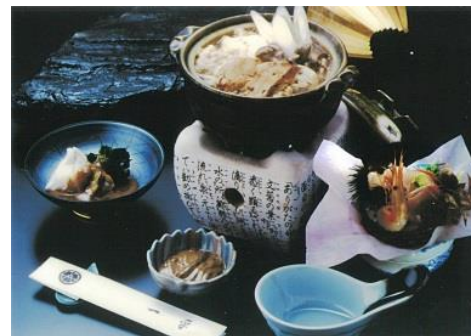
割烹一平のあんこう料理 (イメージ)