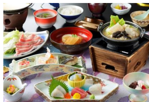
ホテルハワイアンズ夕食 (イメージ)