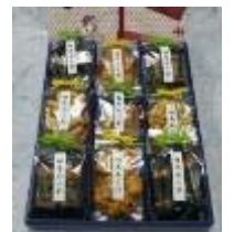
【商品一例】(イメージ) 相馬純米あられ

12月7日（水）～11日（日）に仙台駅で常磐線沿線8自治体（名取市、岩沼市、亘理町、山元町、新地町、相馬市、南相馬市、いわき市）と連携し、また、JRの関連会社としては、(株)JRとまとランドいわきファームで獲れたトマトなど、地域の特産品の販売やパネル展等を実施します。 詳しくは仙台支社ホームページをご覧ください。https://jr-sendai.com/