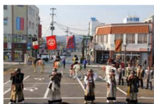
騎馬隊おもてなし (イメージ)