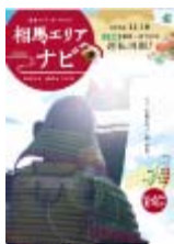
観光ガイドブック (イメージ)

相馬エリアや仙台圏等の観光地をPRする宣伝物を小高～仙台駅間の主要駅等に掲出するほか、原ノ町駅等で相馬家の家紋をあしらった陣幕を設置し、常磐線を利用した旅行需要を喚起していきます。また、相馬エリアの現場社員によるエンブレム着用やのぼり旗等で運転再開を情報発信していきます。