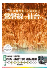
B1ポスター (イメージ)