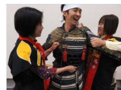
甲冑着付け体験（イメージ）