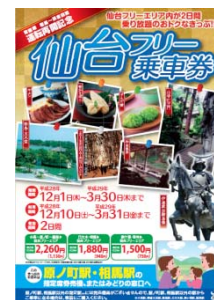
仙台フリー乗車券チラシ (イメージ)