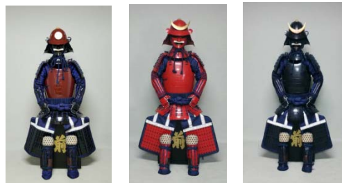
試着甲冑（イメージ）