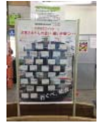
原ノ町駅での掲出例 (イメージ)