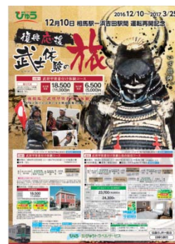
旅行商品パンフレット（イメージ）

※その他の発着駅や宿泊コースをご利用の場合の料金等、詳しくは専用パンフレットをご覧ください。