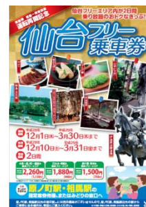
仙台フリー乗車券チラシ (イメージ)