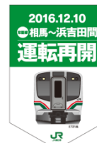
フラッグ (イメージ)