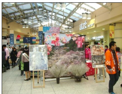
【観光ブースアイキャッチ】