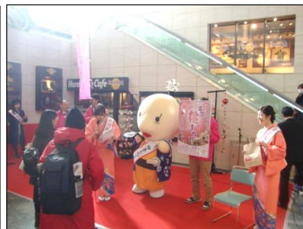
【イベントステージ】