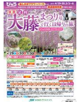
あしかが商品パンフレット