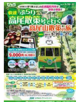
高尾商品パンフレット