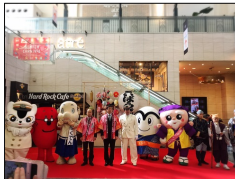
【イベントステージ】