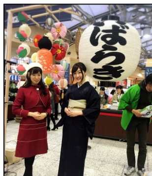
【観光ブースアイキャッチ】