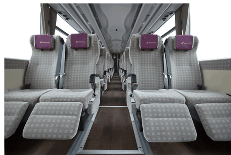
プレミアムバス『葵』／茨城交通（株）