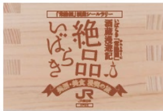
シール入れ 升焼印デザイン