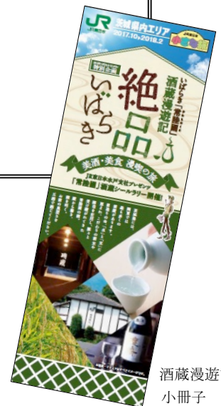
酒蔵漫遊記 小冊子