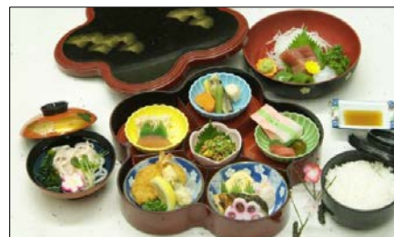
びゅう特製偕楽園御膳