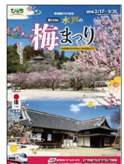
旅行パンフレット(表紙)