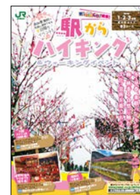
「駅からハイキング」 パンフレット