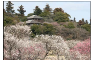
【日本三名園偕楽園イメージ】

2018年 2月17日(土)・18日(日)・24日(土)・25日(日) 3月 3日(土)・4日(日)・10日(土)・11日(日) 17日(土)・18日(日)・21日(水・祝)・24日(土) 25日(日)・31日(土) 計14日間