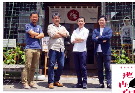
▲「曲がり松商店街」のみなさま