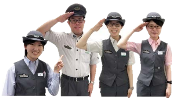
▲勝田駅・水戸駅社員