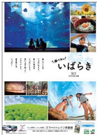
▲首都圏各駅掲示（B1ポスター）

◆小さな旅と連動したポスター、国営ひたち海浜公園を夏のコキアを中心とした、「一日遊べる場所」として紹介するポスターの2種類で、「夏のいばらき」をPRします。