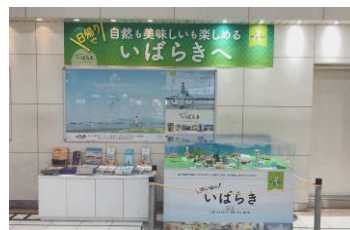
▲2018年春ジオラマ駅装飾

次回の、いばらきの秋「泊まれるっ いばらき（案）」では、いばらき県北エリアを中心にご紹介します！お楽しみに！