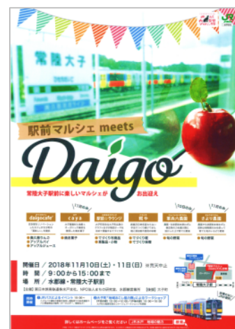
ポスターイメージ