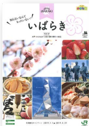
▲A4 サイズ特別版 「小さな旅」小冊子