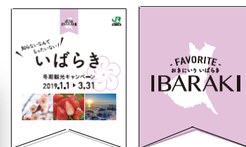
▲フラッグ(オモテ) (ウラ)