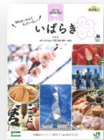
▲A4 サイズ特別版「小さな旅」小冊子