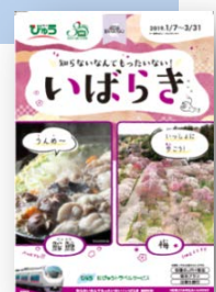
▲旅行商品パンフレット