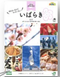
▲A4 サイズ特別版「小さな旅」小冊子