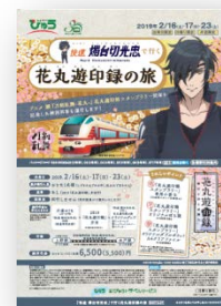
▲旅行商品パンフレット