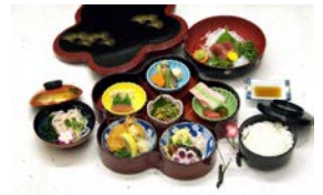
びゅう特製偕楽園御膳 (イメージ)

発売箇所：びゅうプラザ(旅行カウンター)のほか、びゅう予約センター、 当社のインターネット予約サイト「えきねっと」にて発売します。