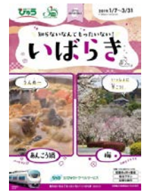
パンフレット (イメージ)