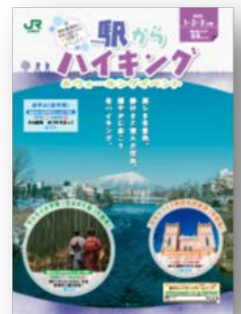
パンフレット(イメージ)