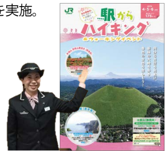
▲「駅からハイキング」パンフレット

その他のコースもございます。詳しくは小さな旅小冊子「近いね。いばらき」または「駅からハイキング」パンフレットをご確認ください。