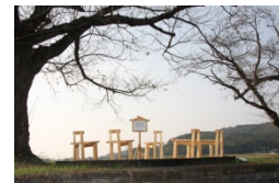
▲雨引きと里の彫刻 2015の様子