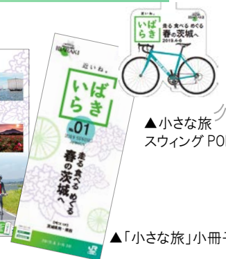
▲小さな旅 スウイングPOP