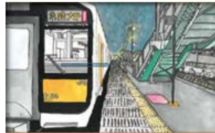
【高学年の部 金賞作品（2018年度）】

共 催：東日本旅客鉄道株式会社 水戸支社 協 賛：ぺんてる株式会社 東京海上日動火災保険株式会社 後 援：福島県鉄道活性化対策協議会 茨城県公共交通活性化会議