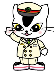
旅のナビゲーター ムコナ