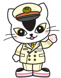
〈旅のナビゲーター ムコナ〉

〈ユーザー名〉 @jre_mito_657 (https://twitter.com/jre_mito_657)