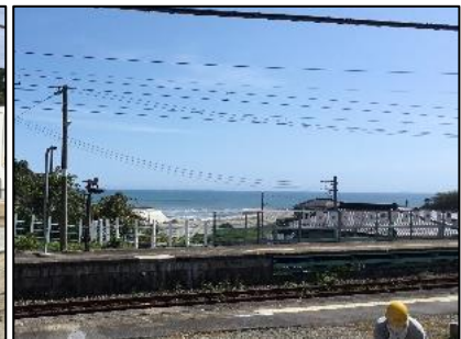
ウッドデッキからの眺め