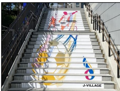
ホーム階段アート