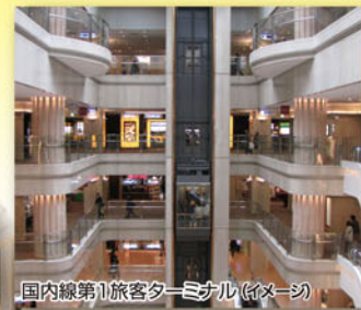
国内線第1旅客ターミナル (イメージ)