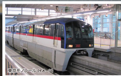
東京モノレール (イメージ)