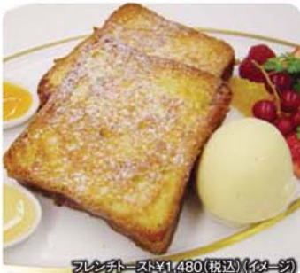
フレンチトースト ¥1,480(税込) (イメージ)