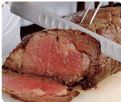
ローストビーフ(イメージ)