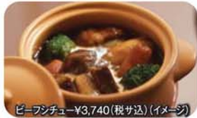
ビーフシチュー ¥3,740(税込) (イメージ)